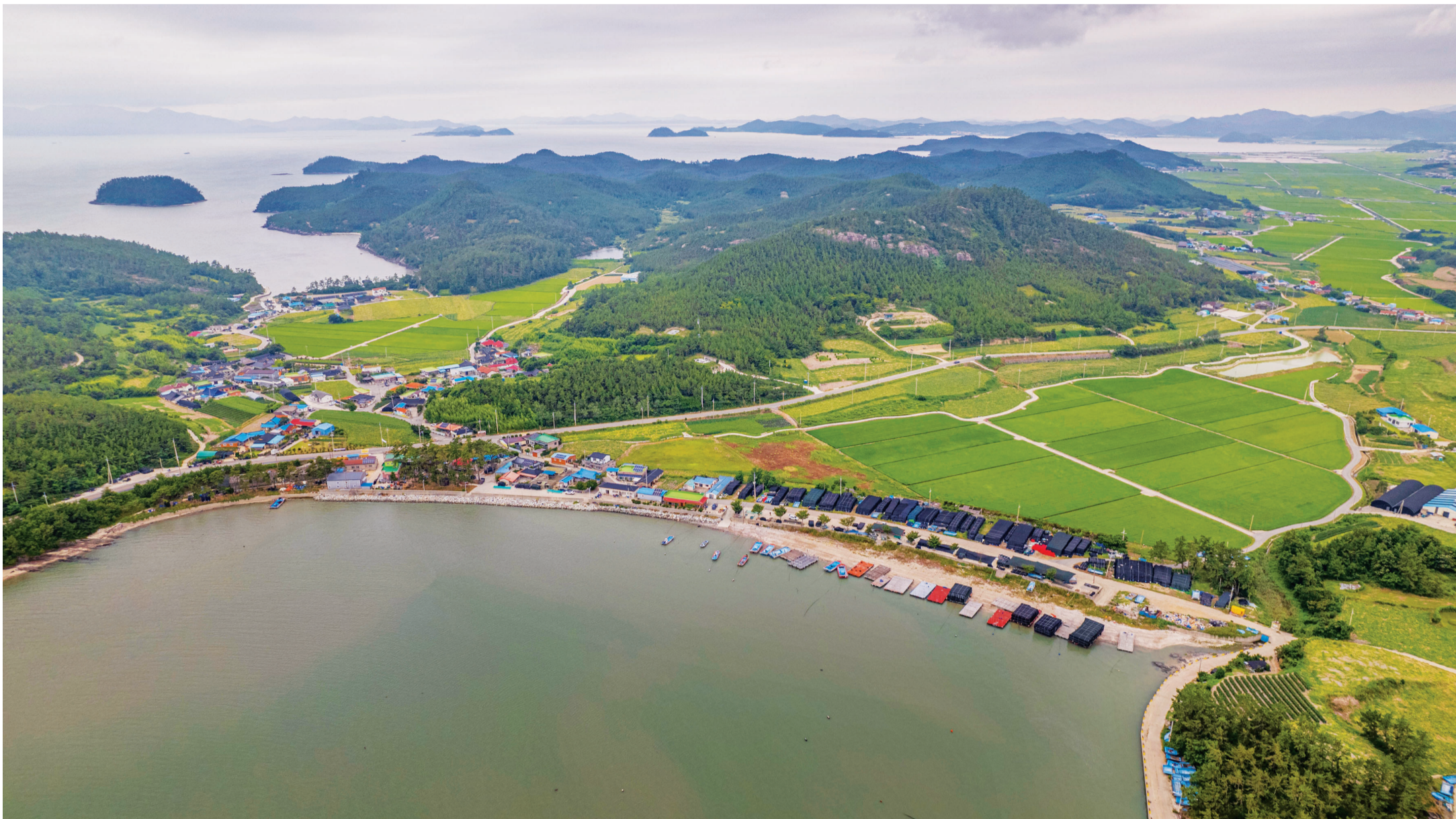
산·들·바다에 둘러싸여 온통 푸르른 동현마을. 주민 170여명이 양식업과 농업에 종사하며 '한식제'라는 마을 전통을 200년째 이어오고 있다.