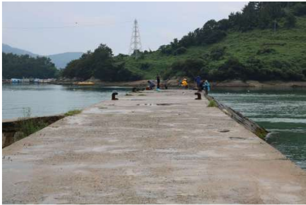
독정항 내 사람들이 낚시를 하는 사진