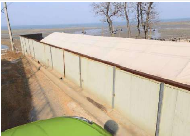
영암어촌계 사무실 가는 길