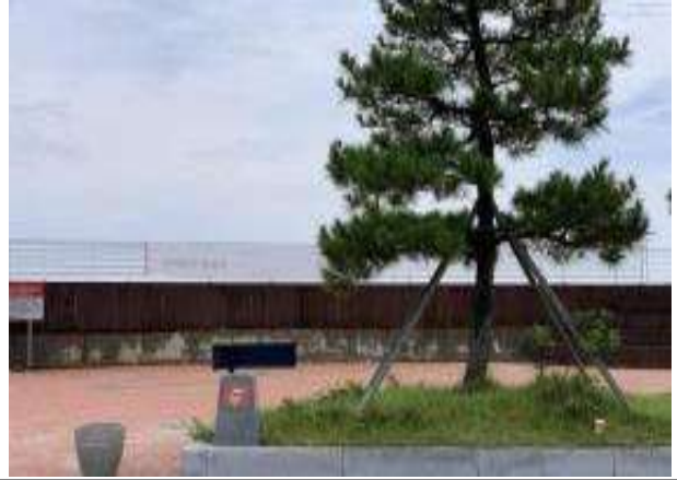
민간재능기부 요청 장소