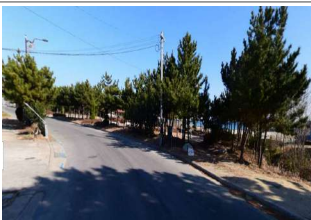
마을 입구(해수욕장 주변)