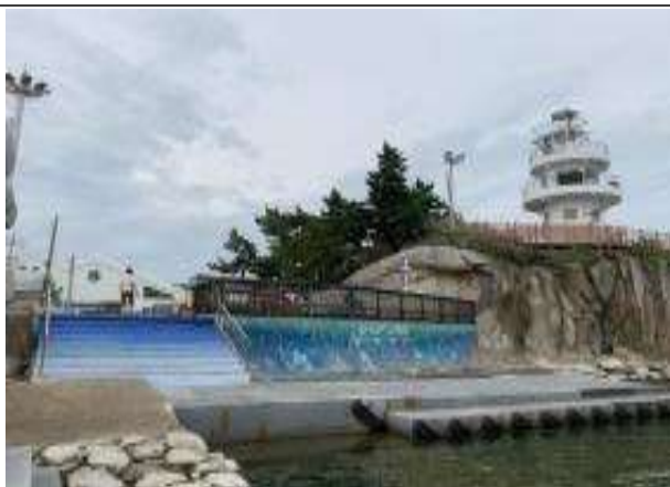
강원어촌특화지원센터 지원을 받아 제작된 체험장 내 벽화 및 계단