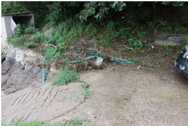
쓰레기를 버리는 곳이 없어 한 구석에 버린 사진