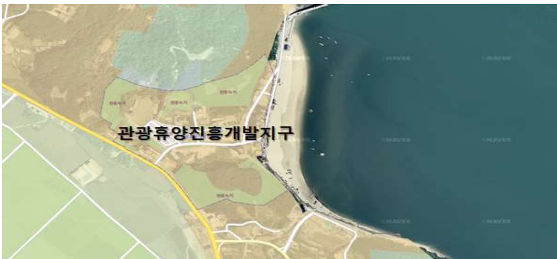
[그림 2] 관광·휴양진흥개발지구 &amp; 완충녹지