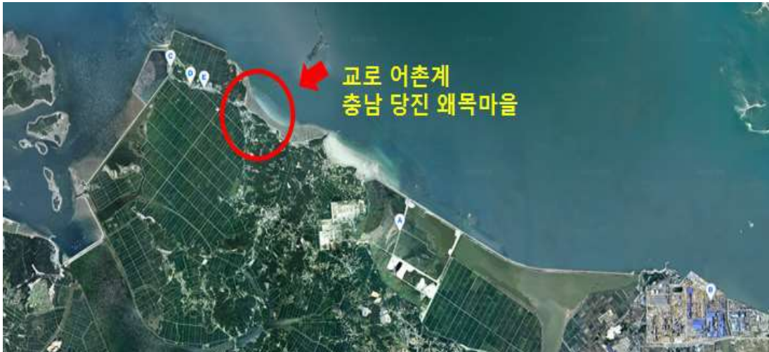
[그림 1] 충남 당진의 교로어촌계(왜목마을)