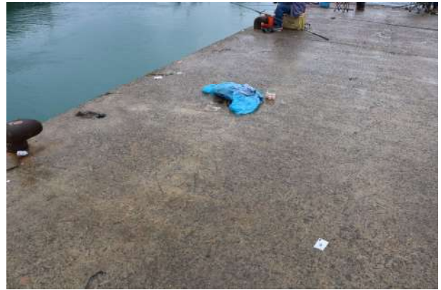
낚시꾼들이 쓰레기를 그대로 버린 사진