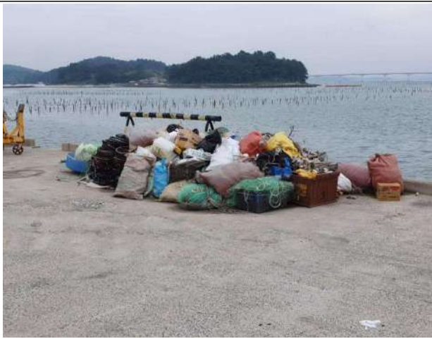
마을 인양기옆 쓰레기 보관장소