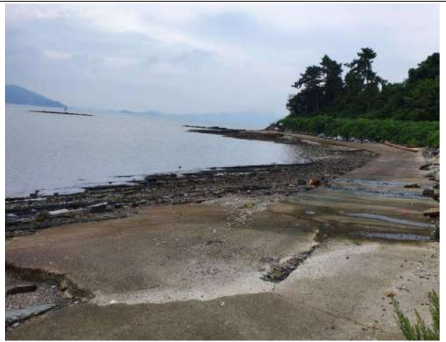
마을 1종지선 진입로