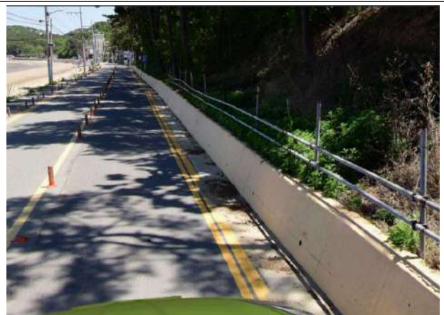
장경리해수욕장 앞 도로