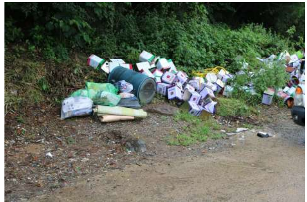
쓰레기를 버리는 곳이 없어 한 구석에 버린 사진