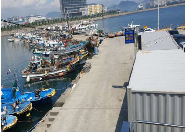
하리항 방파제 물량장