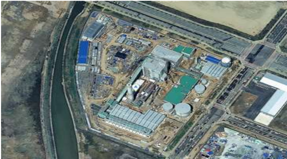
[그림 3] 왜목마을에 인접한 화력발전