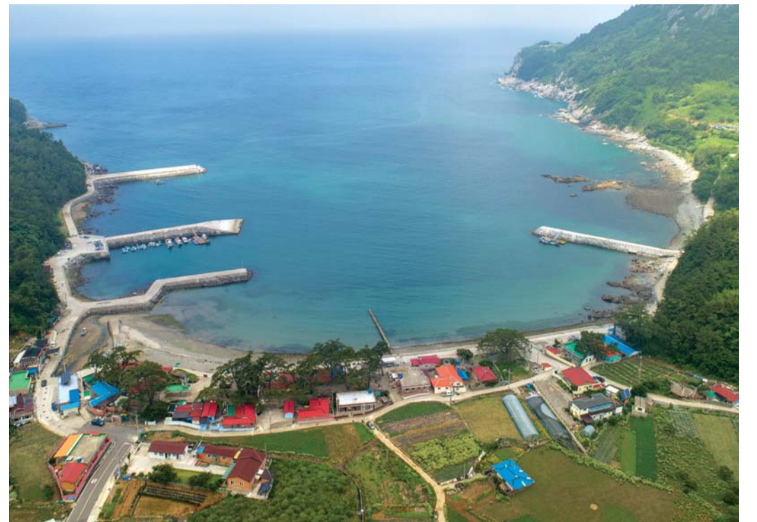
매봉(왼쪽 산맥)과 옥녀봉에 둘러싸인 여수시 남면 두모리 직포마을 전경. 마을이름인 '직포'는 베를 엮어 낚실의 틈을 고르게 하는 도구 '보대'의 한자말에서 따왔다.